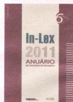
Directório | Capa da edição de 2011 do anuário das sociedades de advogados.

O anuário “In-Lex” foi publicado pela primeira vez em 2006. Desde essa edição inicial, o número de sociedades participantes registou um crescimento de 50%, já que o caderno deste ano contou com 150 sociedades de advogados. A inclusão neste projecto pode ser feita em “ www.in-lex.pt ”, o mesmo endereço electrónico que dá acesso ao directório online.