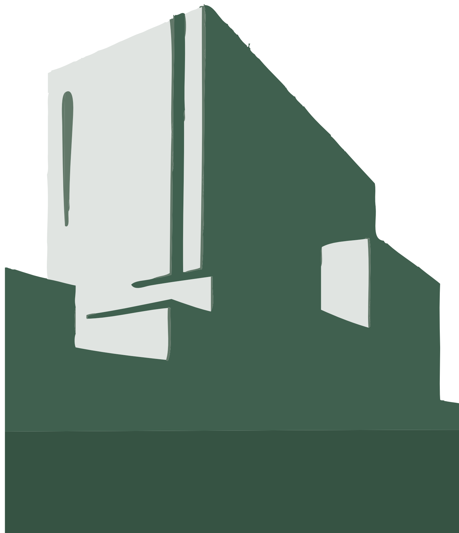
Imagem institucional da Sociedade de Advogados