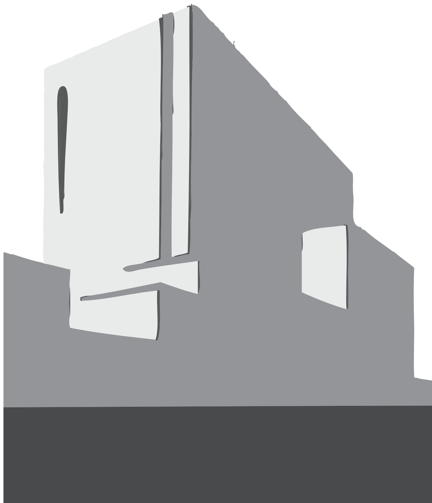
Imagem institucional da Sociedade de Advogados