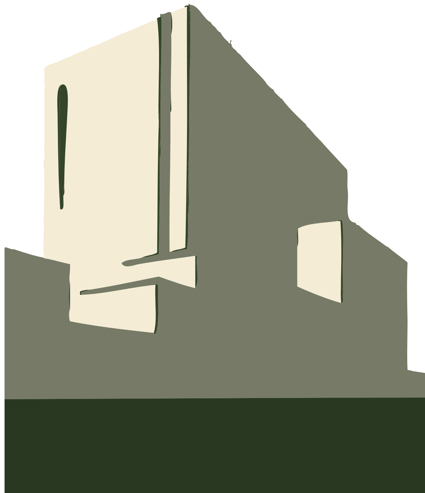
Imagem institucional da Sociedade de Advogados